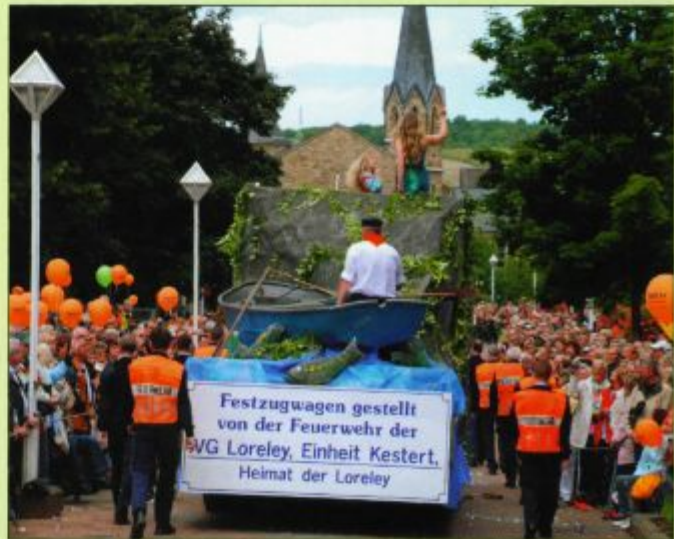
Die Feuerwehkameradinnen und -kameraden aus Kestert begleiten den Festwagen ihrer „Loreley“ im Festumzug in Bad Neuenahr

auch viele Freunde im In- und Ausland gewonnen. Sie war eine perfekte Repräsentantin des Weltkulturerbes „romantisches Mittelrheintal“.