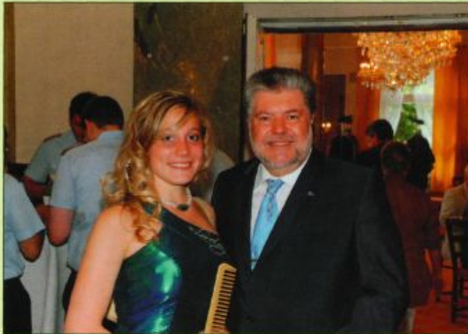
„Loreley-Christine“ mit Ministerpräsident Kurt Beck beim Empfang anlässlich des RLP-Tages in Bad Neuenahr