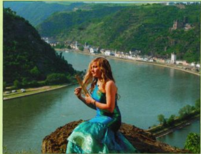
Die Loreley kämmt sich ihr goldenes Haar