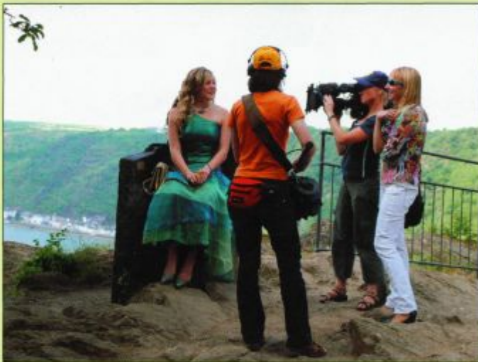
Fernsehteam bei Außenaufnahmen am Loreleyfelsen