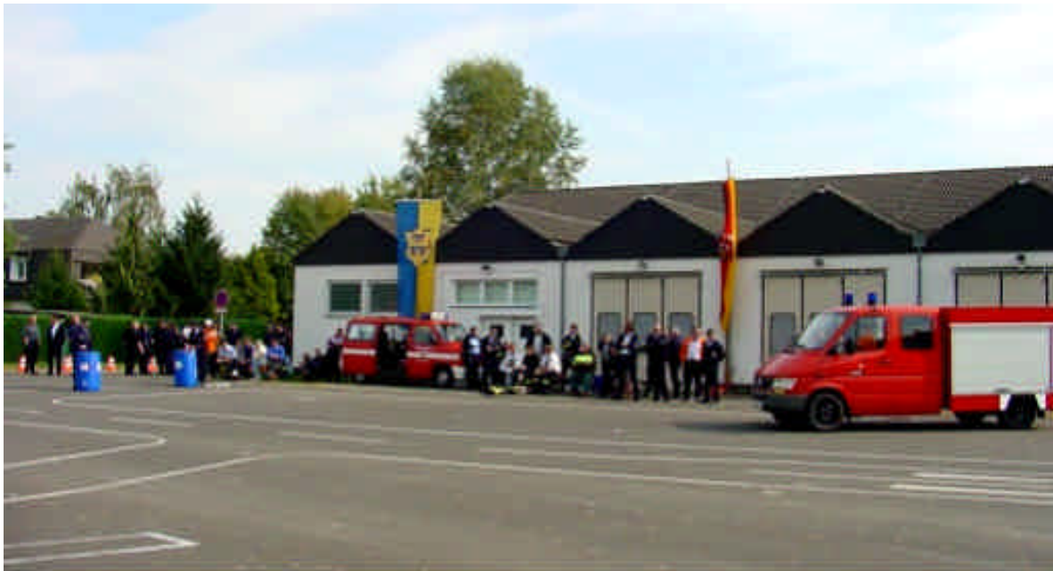
Geschicklichkeitsfahren in Hahnstätten

Der Landesentscheid im Geschicklichkeitsfahren wurde im vergangenen Jahr am 29.09.01 in Hahnstätten durchgeführt. An dem Landesentscheid nahmen 34 Einsatzfahrer, jeweils 17 in der Klasse A und B, teil. Es war eine sehr schöne und von dem KfV Rhein-Lahn sowie der örtlichen Feuerwehr gut organisierte Veranstaltung. Bemerkenswert war die Tatsache, dass in der Klasse A der Vorjahressieger seinen Erfolg wiederholen konnte. Das war kein Zufall, sondern bestätigt die Auffassung mit verstärktem Training bekommt ein Einsatzfahrer mehr Routine und Sicherheit.