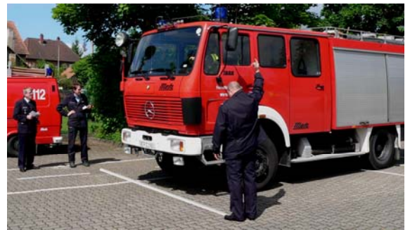
Start der Bewertungsfahrt