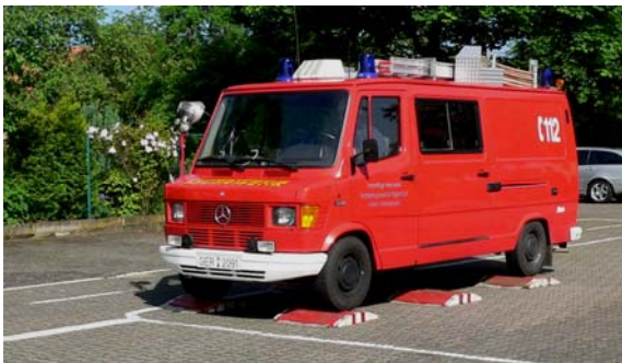
Fahrt über die Schlauchbrücken

Anhalten zwischen den Schlauchbrücken = 25 Fehlerpunkte