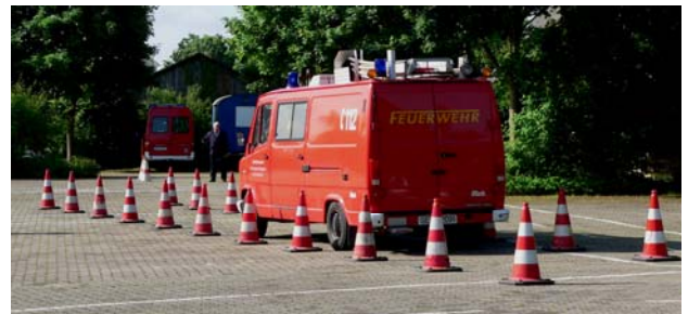
Befahren der Spurgasse