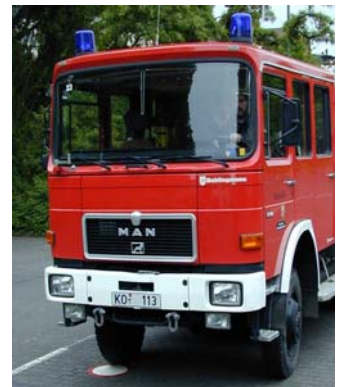
Korrektes Anhalten innerhalb der Markierung

Die Tonnen werden gleichzeitig, langsam von der Fahrbahnmitte auseinander gezogen bis der