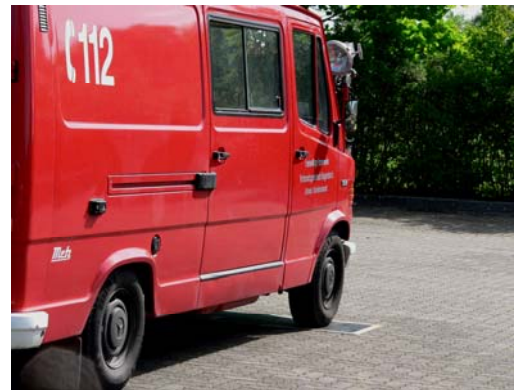
Korrektes Anhalten innerhalb der Markierung

Vor dem Hindernis angehalten und korrigiert = 100 Fehlerpunkte