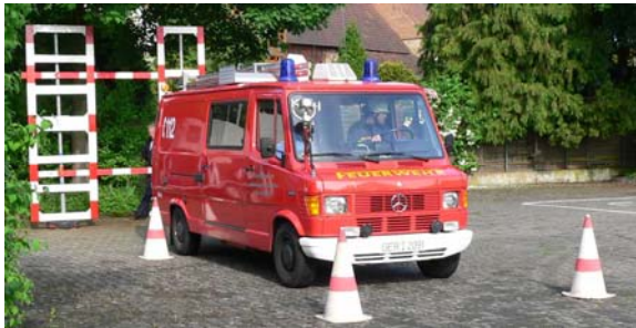
Einfahrt in die Spurgasse und Anhalten am Gatter