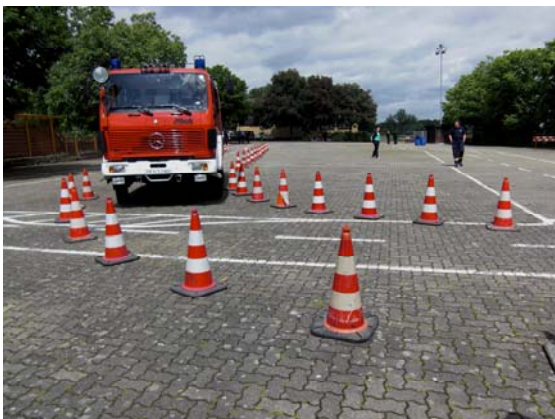
Einfahrt in die Spurgasse

Anhalten in der Spurgasse pro Halt = 10 Fehlerpunkte