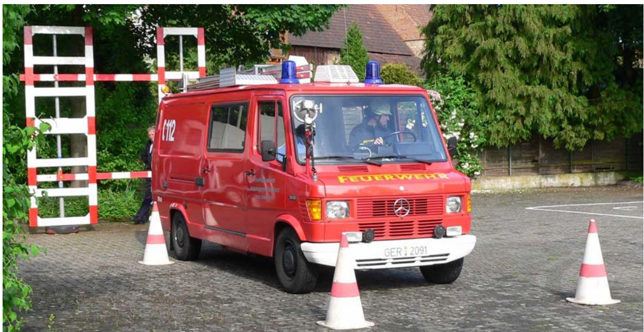
Einfahrt in die Spurgasse und Anhalten am Gatter