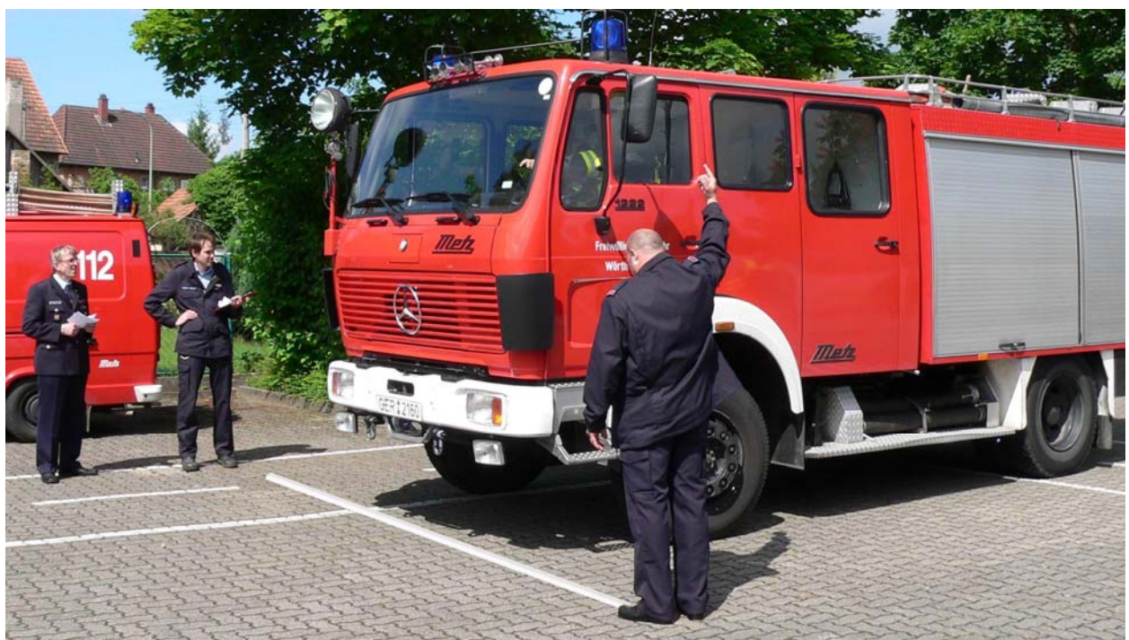
Start der Bewertungsfahrt